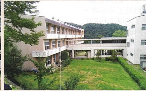
飯田市山本小学校