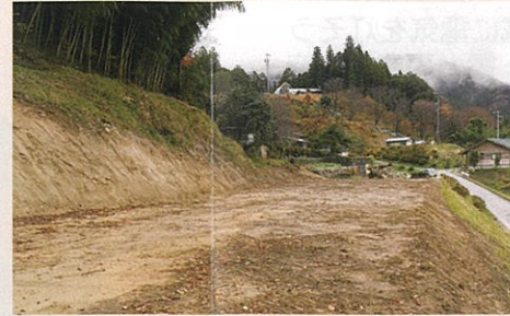
根羽村野立てパネル予定造成地