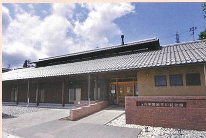
満蒙開拓平和記念館(阿智村)

現在のエネルギー政策、とりわけ原発のあり方も少し立ち止まり、丁寧な議論が必要ではないかと思えます。