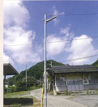
阿南町照明LED化事業